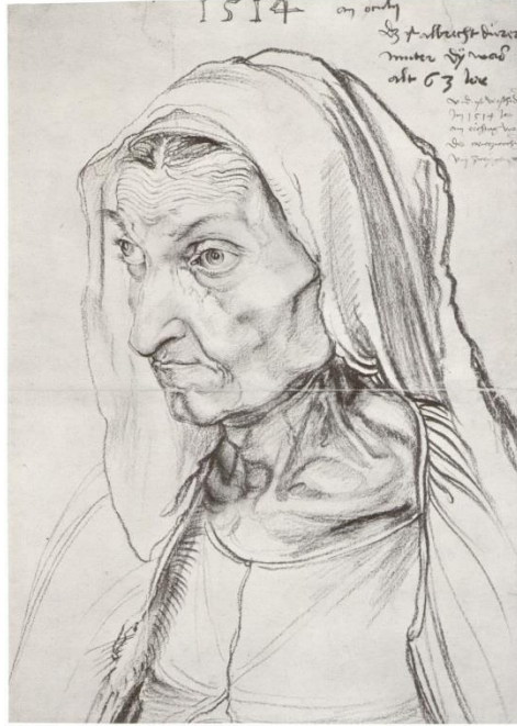
Resim 1. Albrecht Dürer, “Sanatçının Annesi”, 1514.

Sanatta alternatif arayışlara örnek olarak verilebilecek sanatçı Albrecht Dürer’dir. Dürer 15. yüzyılda yaşamış Alman sanatçısıdır. Sanatçı diğer çağdaşlarından farklı olarak eserlerinde karakter arayışına önem vermiştir. “Dürer, çizgiler içindeki biçimlere tarama yoluyla ışık-gölge etkisi vererek üç boyutlu bir görünüm kazandırmıştır” (Özkartal, 2009: 64). Böylece birbirinden farklı biçimlemeye önem vermiştir. Aynı zamanda ekspresif resim tarzıyla ifadeyi anlamlı kılan bir arayışı vardır. Rönesans dönemi çağdaşlarından farklı olarak kendine özgü resim üslubu vardır. Onu diğerlerinden ayıran şey; gerçekçi çizim ve renk canlılığı değildir. Resimlerinde kavramsal ve fikrî karakterler yaratmasıdır. Gerçeklik, onun resimlerinde içsel duyarlılığın dışa yansımasıdır. Dolayısıyla sanatçı o dönem için alternatif bir arayış olarak ifadeyi zenginleştirmiştir.